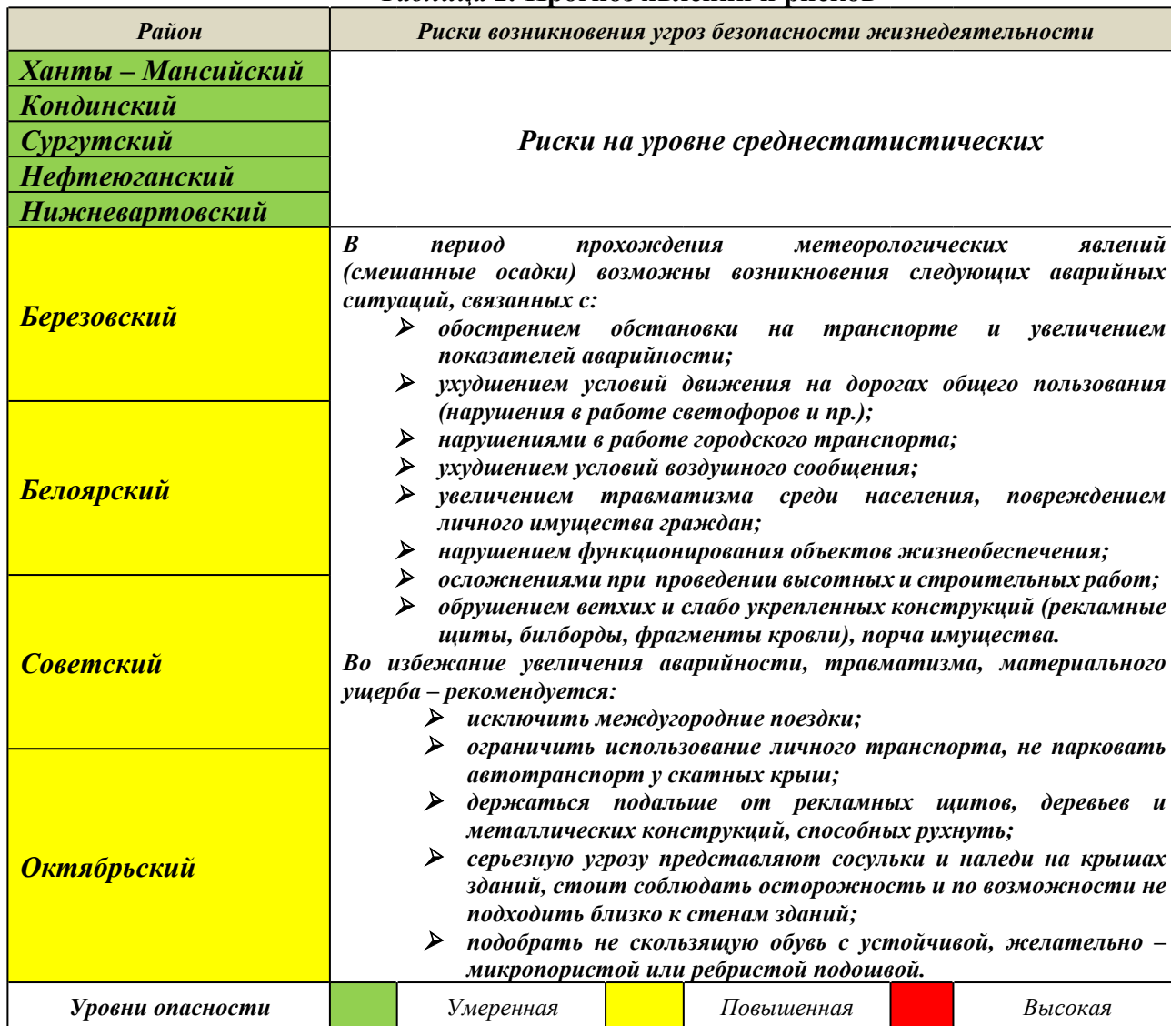
Таблица 2. Прогноз явлений и рисков

4 по данным АО «Государственная компания «Северавтодор»